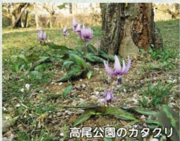
高尾公園のカタクリ