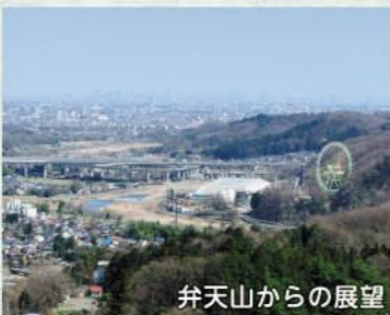
弁天山からの展望