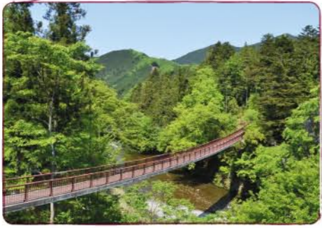
秋川渓谷のシンボル。橋からは、新緑や紅葉など四季折々に変化する深谷美が楽しめる。