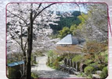
白梅や山野草の咲く山間の禅寺。境内の横を流れる養沢川には虫が舞う。